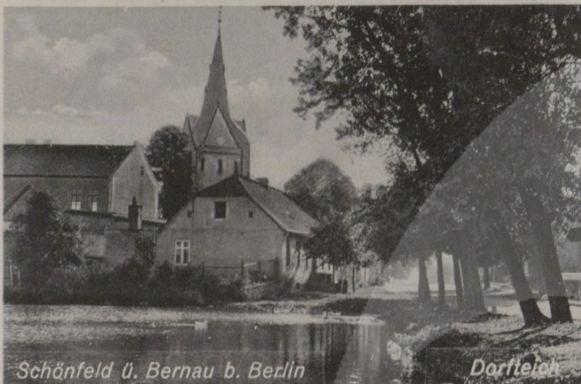
Schönfeld ü. Bernau b. Berlin